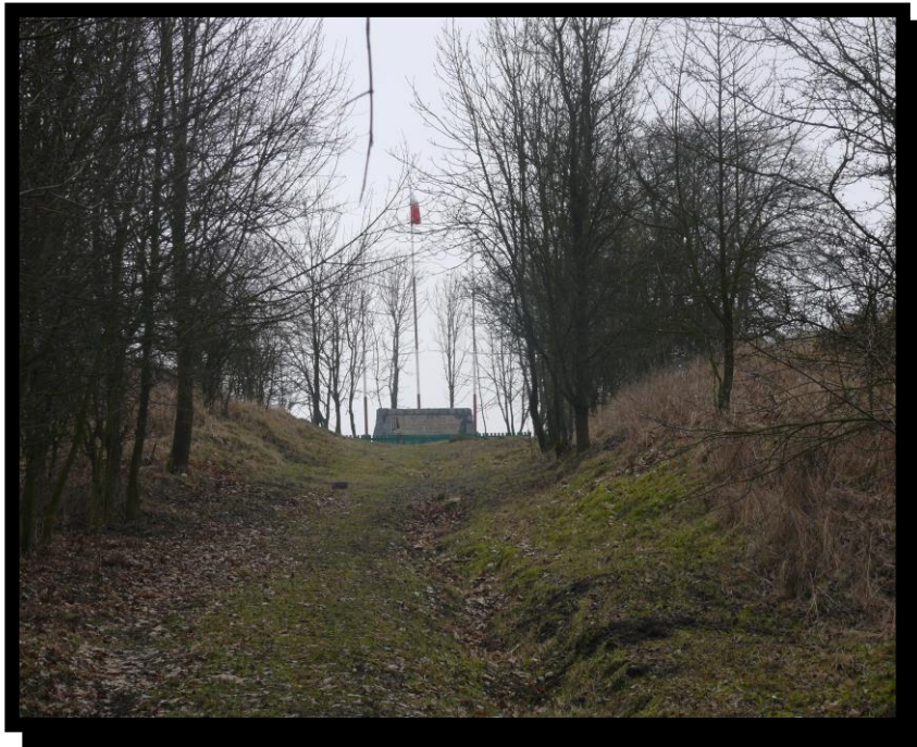
Rys. 2 Wąwóz prowadzący do miejsca pamięci narodowej.

Za Cytrynowem na szczycie wzgórza, do którego prowadzi wąwóz znajduje się miejsce pamięci narodowej, w którym jesienią 1939 roku hitlerowcy rozstrzelali kilkudziesięciu Polaków z Trzemeszna i okolicy. Kiedyś istniał tu przysiółek o nazwie Kociń od nazwy znajdującego się w pobliżu jeziora, jednak obecnie nie ma tu żadnych zabudowań.