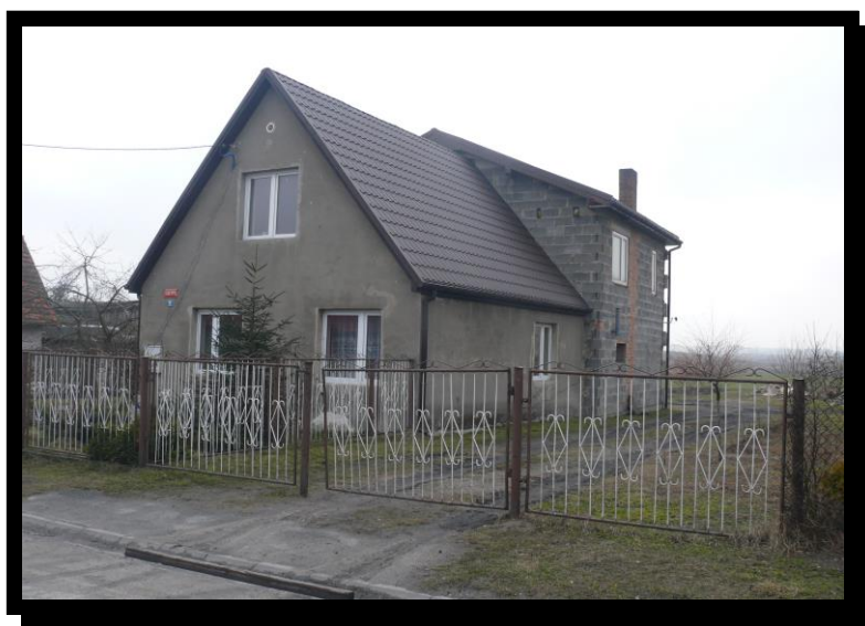
Rys. 4 Zagroda gospodarza wsi.